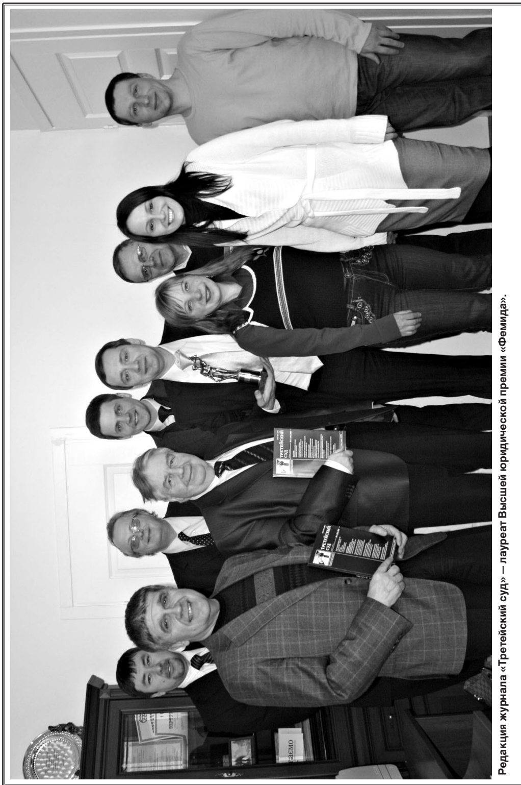
Редакция журнала «Третейский суд» — лауреат Высшей юридической премии «Фемида».